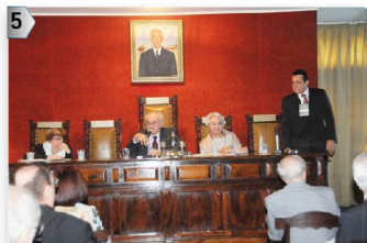
1ª MESA: AM - PA