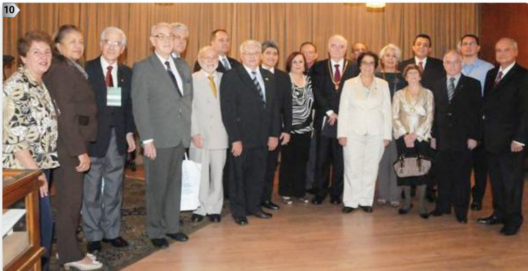
1 Sessão de Abertura