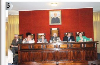
4ª MESA: BA - MG - RJ