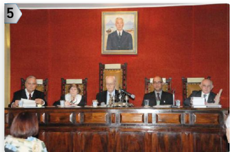
3ª MESA: PE - AL - CE