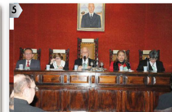
2ª MESA: MA - CE - PB