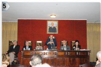
5ª MESA: SP - PR - SC - RS