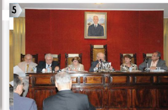
6ª MESA: DF - GO - MT - MS